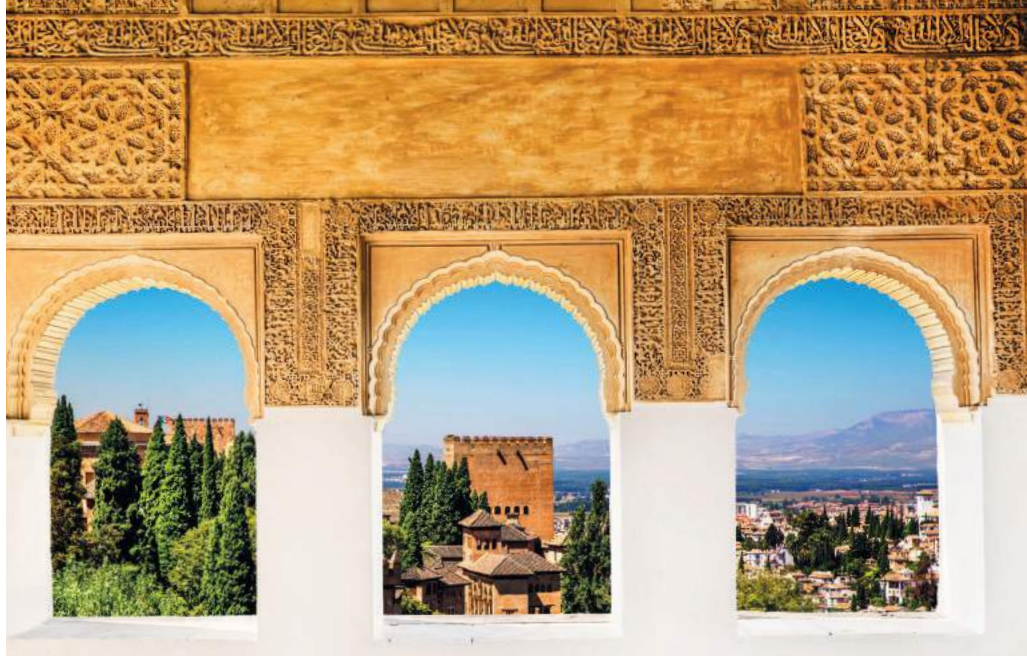
GRANADA - ALHAMBRA